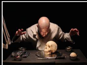
SOMNAMBULES Karavan Ensemble

Presso Scuola Media - Via dei Bersaglieri, 68