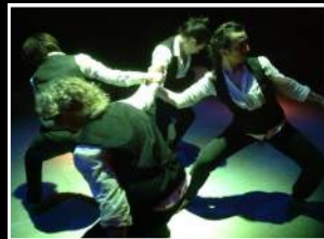
EDGAR ALLAN POE Laboratorio Teatro Officina